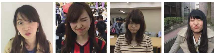
撮影に協力していただいた「にらめっ娘」さん達

ダイガク.TV公式 vineアカウント : https://vine.co/u/1045795630074957824