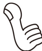
ずも雄氏 イメージキャラクター 「ずも雄氏」