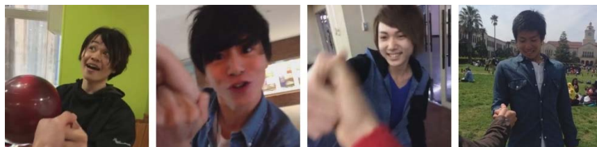
撮影に協力していただいた「ゆびずも雄」さん達