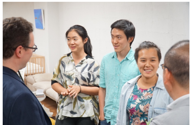
ミネルバ大学のインターン生とのディスカッション風景