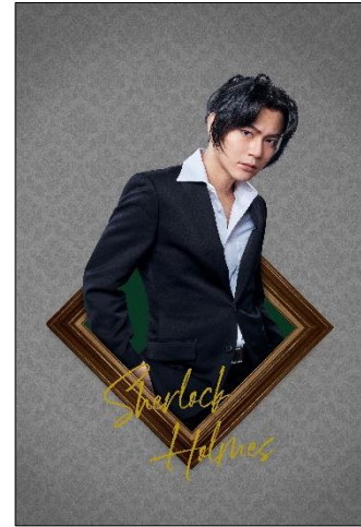
シャーロック・ホームズ 平野良