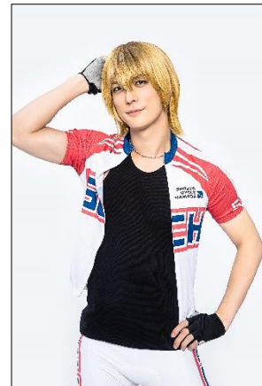
小関将 役：君沢ユウキ