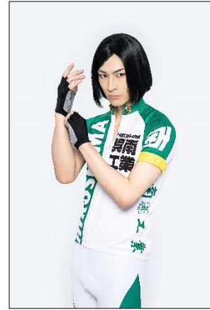
井尾谷諒 役：田内季宇