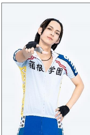
東堂尽八 役：遼太郎