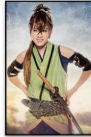
藤堂平助 役:樋口裕太