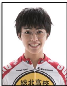
小野田坂道 役: 醜醐虎汰朗