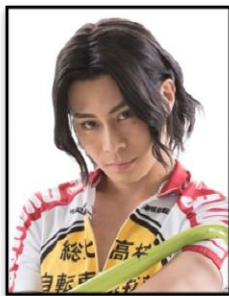
手嶋純太 役: 鯨井康介