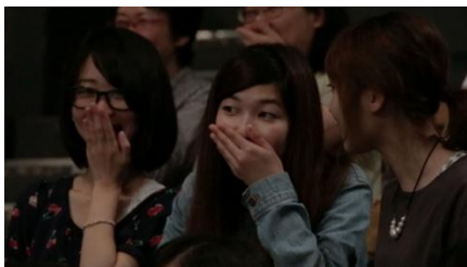
観客： (息をのむ・・・)