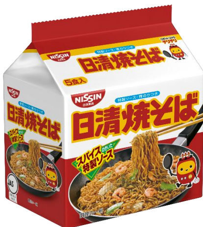
日清焼そば 5食パック