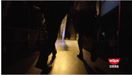
トレンドイエエンジェル： どーもー！