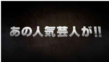
ナレーション： あの人気芸人が！