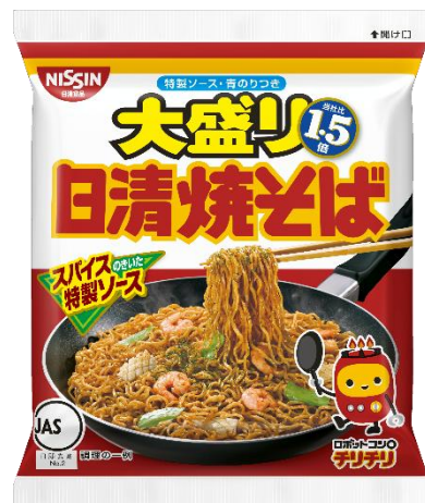
日清焼そば 大盛り1.5倍