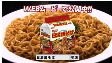
ナレーション： サプライズ漫才の結果は、 日清焼そばで検索。