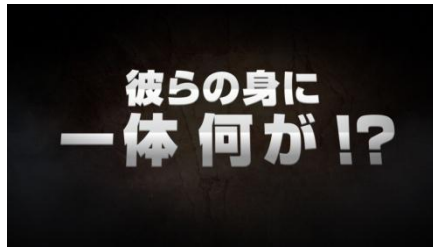
ナレーション： 彼らの身に一体何が起きたのか？！