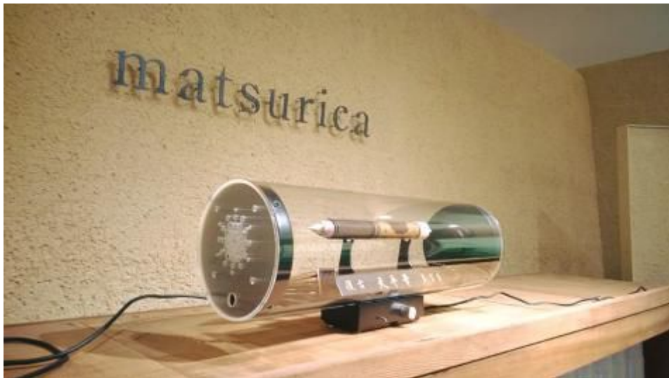
音楽療法士がディレクションする店内BGM。このスピーカーの中には、復古させた天平筆が。

新しい時代にあるべき社会の構築を目指し、建築的思考を背景にしたモノ・コト・ヒトの「美しい関係」を設計する。その建築を環境と時間のデザインと捉え、都市計画、建築からインテリアやブランディングまで、異分野を統合したデザインを手掛ける。仕事は国内外で評価・出版され、学会作品選集新人賞、JCD 賞二年連続銀賞、DFA など、受賞歴も多数。日本大学/早稲田大学 非常勤講師。被災地支援らく×トモ所属。