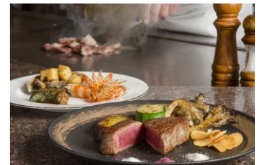
銘柄牛ステーキコース (イメージ)