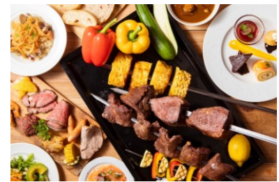
シュラスコ (イメージ)