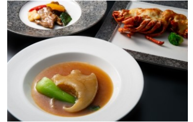
エクセレントコース (イメージ)