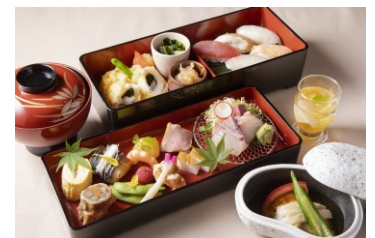
鯉城二段重 (イメージ)