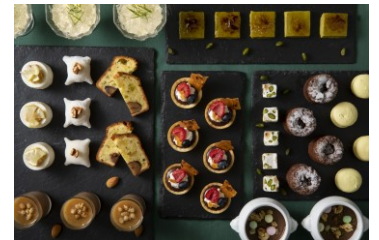
スイーツビュッフェ (イメージ)