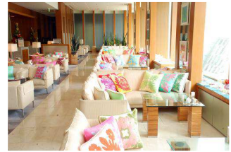
ハワイアンラウンジ イメージ

【名称】ハワイアンラウンジ 【場所】ザ・プリンス パークタワー東京 ロビーラウンジ(1F) 【期間】2016年7月1日(金)～8月31日(水) 【時間】9:00A.M.～9:00P.M.(L.O. 8:30P.M.) 【席数】125席 【お客さまからのお問合せ】ザ・プリンス パークタワー東京 TEL: 03-5400-1111(代表)