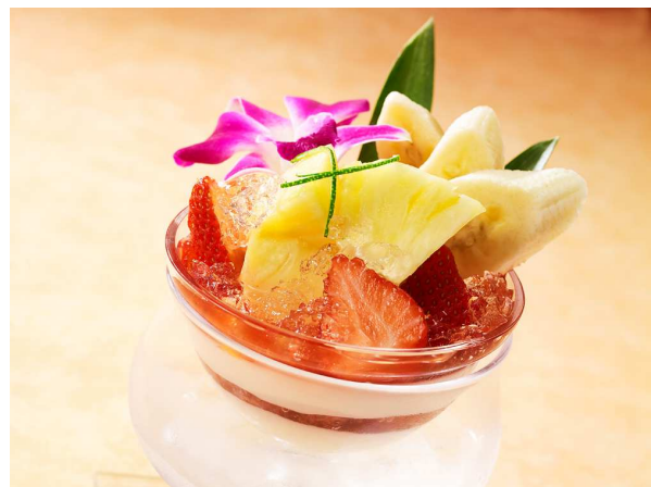
ハワイマムのハウピアパフェ