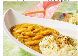
ココナッツ風味のシュリンプカレー