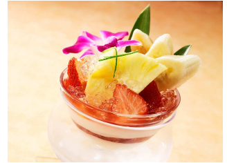
ハワイマムのハウピアパフェ