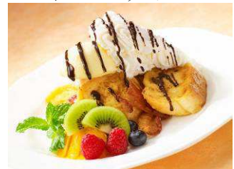
ダイヤモンドヘッド仕立てのフレンチトースト