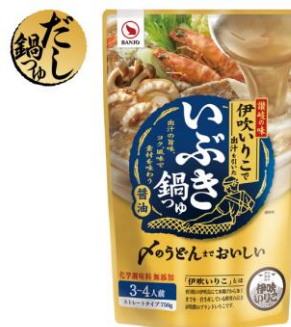
ストレートタイプ

商品名 : いぶき鍋つゆ 販売店舗 : 全国のスーパーマーケット鮮魚売り場、および万城食品オンラインショップなど 内容量 : ストレートタイプ : 750g 濃縮タイプ : 120g (30g×4 袋入) 希望小売価格 : オープン価格 商品紹介ページ : https://www.banjo.co.jp/items/4014 https://www.banjo.co.jp/items/4016