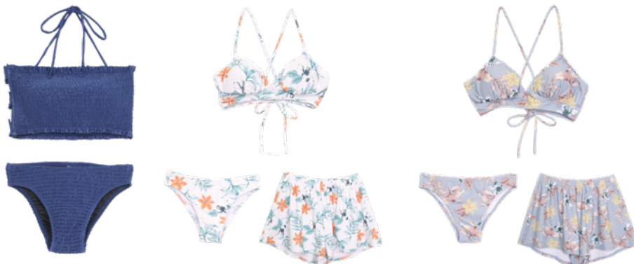
左)Shirring Halter Swimwear ¥9,720 右)Botanical 3piece Swimwear ¥10,800