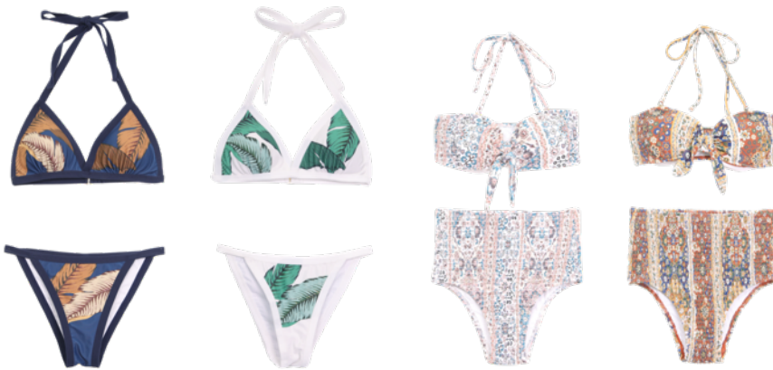
左)Leaf Triangle Swimwear ¥9,720 右)Moroccan Halter Swimwear ¥9,720