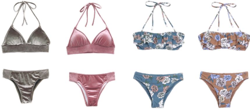
左)Thicc Velor Swimwear ¥9,720 右)Flower Ruffle Swimwear ¥9,720

詳細は公式ECサイトからご覧いただけます。 https://trunc88.com/