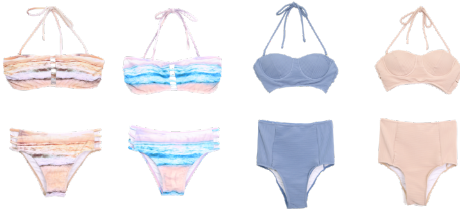
左)Marin Marble Swimwear ¥9,720 右)Pleating Cup Swimwear ¥10,800