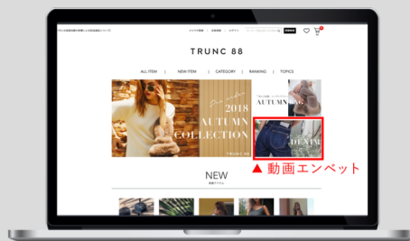
自社サイトへの動画エンベット