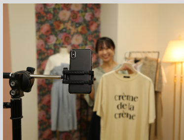
スマホでのライブ配信