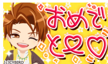
▲デコレーションメール素材：藤堂泰河／ 『スイートルームの眠り姫◆セブ的 贅沢恋愛』