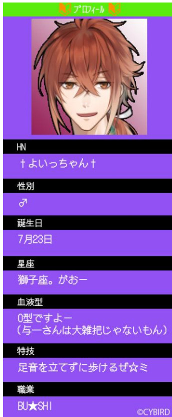
▲プロフィール：那須与一／ 『イケメン源氏伝 あやかし恋えにし』

「イケメンシリーズ」に登場するカレたちが、予め用意された数多くの質問に答えて自己紹介をしていく「プロフィール」や、日々を綴った日記を公開する「ブログ」が公開されます。さらに、とある人物たちによる想像力に富む「夢小説」も、お楽しみいただけます。