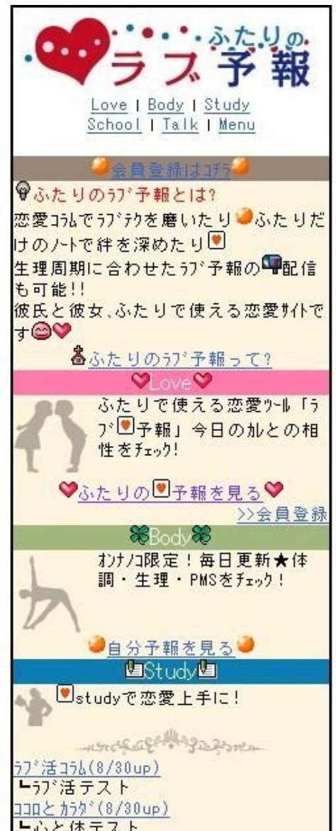
▲サイト TOP 画像

…会話の運び方や初デートで気をつける事など、知って得するラブセオリーを男性、女性別に紹介します。もっと愛されるカラダになるためのアドバイスやメソッドが大充実です。