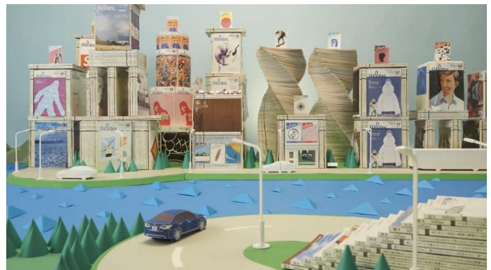
▲relax×LEGACYのスペシャルWEBムービー