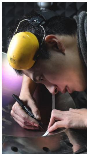
Nikon Creators 賞 KAKERU 氏「Build」