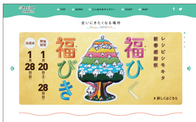
レシピシモキタWEBサイト