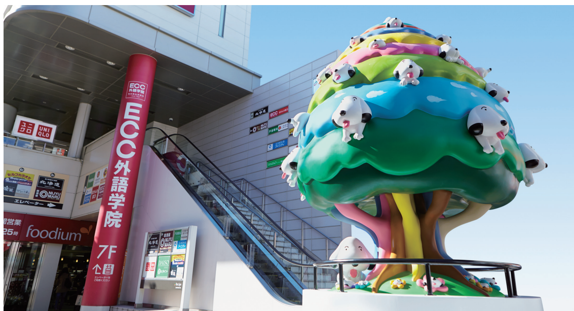
レシピシモキタ広場内「こいぬの木」

下北沢駅南口より徒歩30秒の場所に位置する商業施設レシピシモキタの広場内にあるオブジェ。デザインはイラストレーター、作家、俳優など多方面で活躍するリリー・フランキー氏に依頼し、2015年11月30日に設置されました。今では下北沢の待ち合わせ場所として多くの皆様にご利用いただいております。