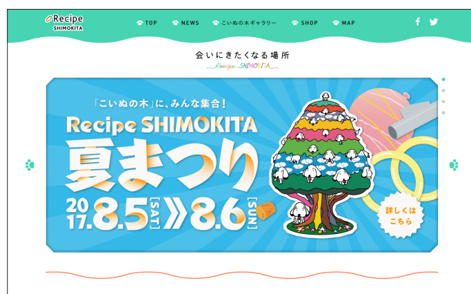
レシピシモキタWEBサイト