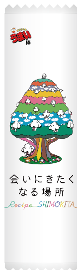
「こいぬの木」オリジナル「うまい棒」