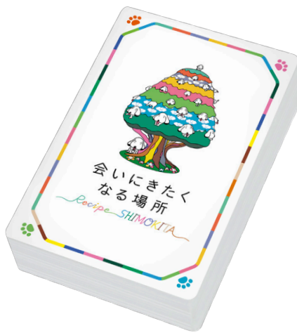
「こいぬの木」オリジナル「トランプ」