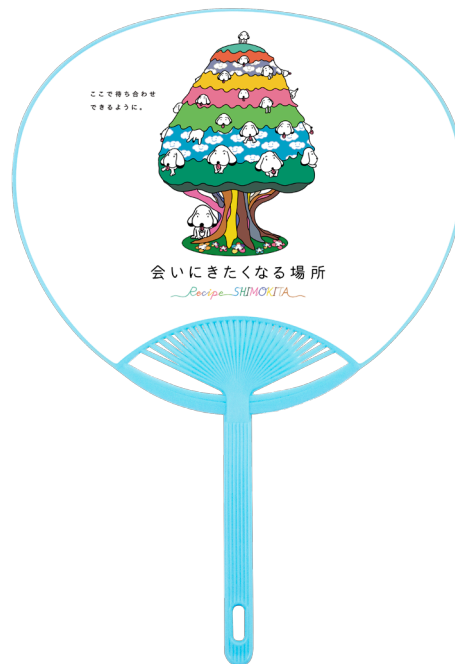
「こいぬの木」オリジナル「うちわ」