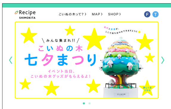
レシピシモキタWEBサイト