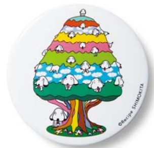
「こいぬの木」缶バッジ