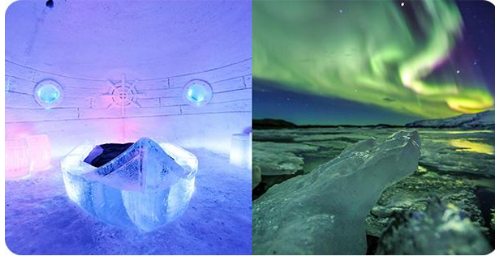
▲アイスホテル宿泊&オーロラが観られる(かも)カチコチ体験ツアー(※画像はイメージです)