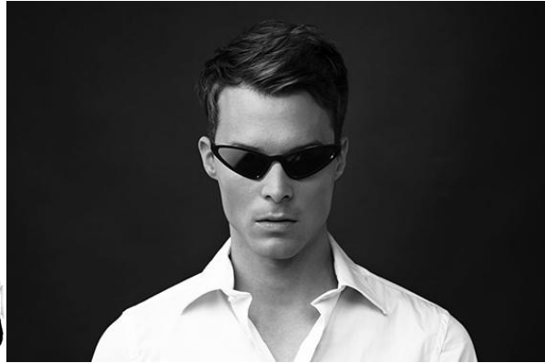
▲戸愚呂(弟)モデルのサングラス ※写真はイメージです