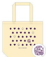
▲トートバッグ アリス