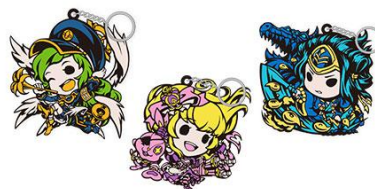
▲デフォルメラパーキーホルダー