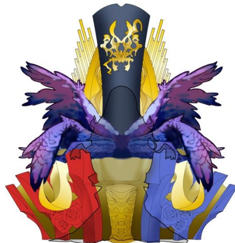
▲なりきりルシファーチェア(イメージ)

※「なりきりルシファーチェア」はイメージ図です。デザインは変更になる可能性があります。