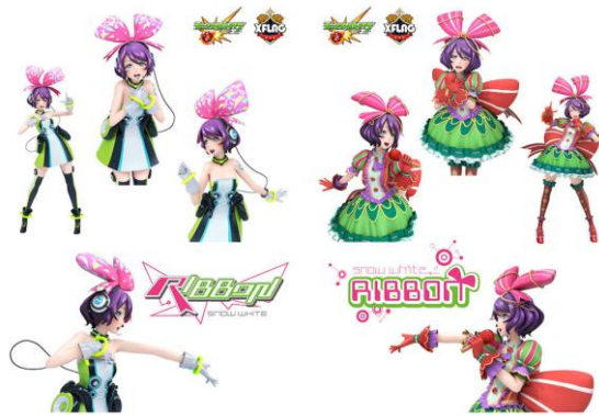
初回限定特典のクリアファイル&ステッカーセット