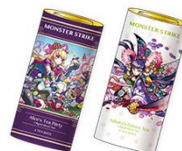
▲オリジナルブレンドティー