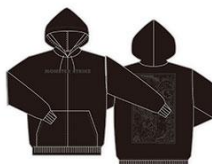
▲パーカー エデンブラック