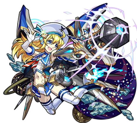
★6 星海の機巧戦姫 ナナミ