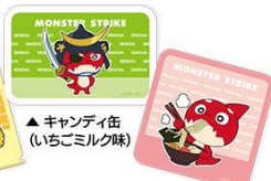
▲キャンディ缶 (いちごミルク味) ▲ミニタオル