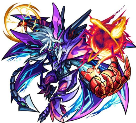
★6 漆黒の蝕 トータル・エクリプス

・モンスター公式サイト : http://www.monster-strike.com/