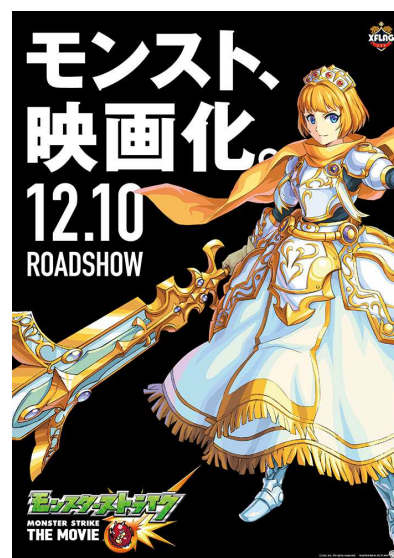
ポスター デザインイメージ

モンスターアニメは、1話を約7分に凝縮した、スマホ時代の新しいアニメフォーマットとして2015年10月10日よりYouTubeにて11言語で世界に配信開始しています。今年3月26日より新章に突入し、大幅なクオリティアップを果たし、同年7月16日には世界累計再生回数8,000万回*を突破いたしました。7月30日には通常1話約7分のところを約50分に拡大した夏のスペシャル版「マーメイドラブソディ」を配信予定です。