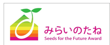
「みらいのたね賞」ロゴマーク

「みらいのたね賞」は、建築家が選ぶ、優れた建築を生み出すことに貢献する優れた製品、未来への布石となる製品に贈られる賞です。一般社団法人 HEAD が開催してきた「HEAD ベストセレクション賞」を継承して、一般社団法人日本能率協会が「Japan Home & Building Show」の公式アワードとして2017年にスタートさせ、今年で5回目を迎えます。 毎年ゲスト選考員を迎え、出展製品の中からテーマに基づき、約10製品を選定、表彰しています。