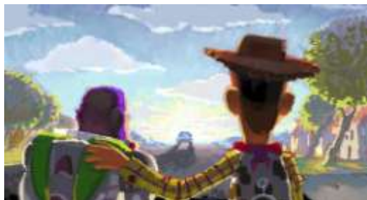
ロバート・コンドウ (レイアウト: ジェイソン・カツ、ジョン・サンフォード) 《ピートボード: さよなら、アンディ》 『トイ・ストーリー3』(2010年) デジタルペインティング ©Disney/Pixar