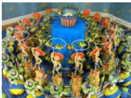
《トイ・ストーリー ゾートロープ》 木、アルミニウム、真鍮、スチール、ガラス、プラスチック、石膏 2005年 ©Disney/Pixar

この世界巡回展のために特別に開発された2つのインスタレーション、「トイ・ストーリー ゾートロープ」と「アートスケープ」が登場します。