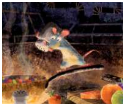
ハーレイ・ジェサップ (レイアウト: エンリコ・カサローザ) 《カラースクリプトの習作: ラタトゥイユを作るレミー》 『レミーのおいしいレストラン』(2007年) デジタルペインティング ©Disney/Pixar