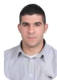
京都大学 Medicine Neuroscience専攻