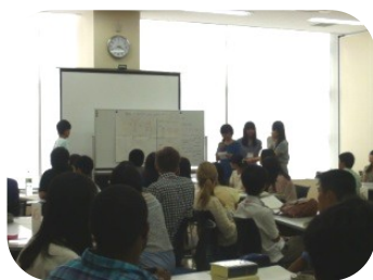
プロジェクト発表の様子