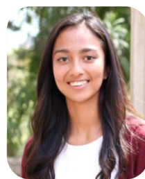
カリフォルニア大学 デービス校 Computer Engineering専攻