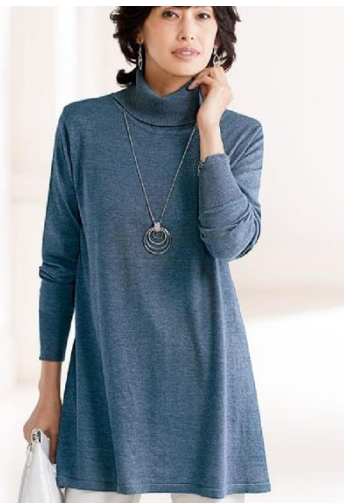
<チュニック>2,990 円～(税別)