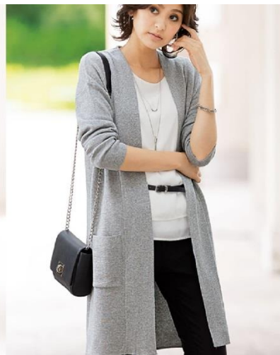
<カーディガン>3,990 円～(税別)

冷たい風の吹く時期は、普段肌トラブルを抱えていない人でも乾燥により刺激に敏感な肌状態となります。衣服による「チクチク」「かゆい」を防ぐには、「肌にやさしい天然素材」「ほどよいゆとりのあるシルエット」「自宅でのお手入れができる」という3つのポイントを備えているかが重要となります。