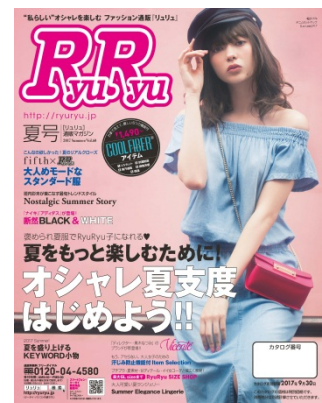
<RyuRyu 2017 夏号>