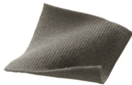
<程よい厚みのある素材>