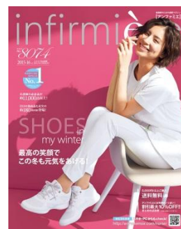
<アンファミエ 2015 冬>