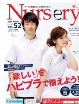
<ナースリーVol. 52 冬号>