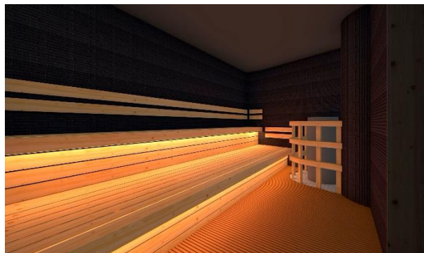
オートロウリュサウナ

数々の銭湯設計を手がける今井健太郎氏が設計した「内観へと誘う空間」をコンセプトにしたデザイン性のある温浴空間となっています。 ※女性エリアのみ