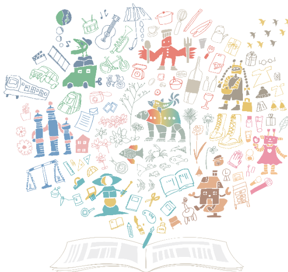
GOOD LIFE フェア 2022