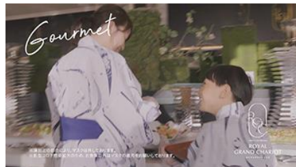
ビュッフェで楽しい食事