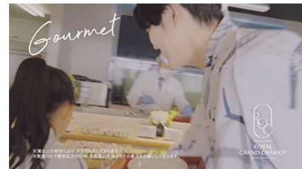
多彩な料理を楽しむ親子