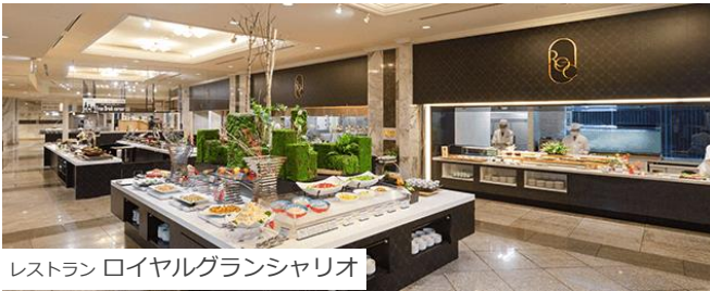
レストラン ロイヤルグランシャリオ

全国屈指の名湯、定山溪温泉。広々とした大浴場「湯酔郷」と、地上60mのホテル最上階から定山溪の景観を楽しめる展望大浴場「星天」をご用意しています。湯量豊富な名湯が、あたたかく包んでくれる至福のひとつをお楽しみください。