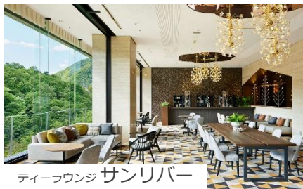
ティーラウンジ サンリバー