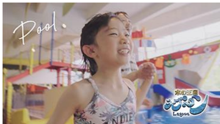
「水の王国ラグーン」で楽しげな表情