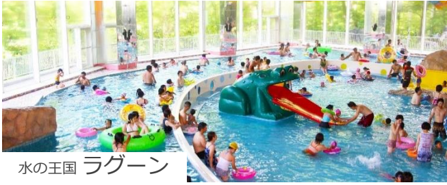
水の王国 ラグーン

約4,000㎡の総面積を誇る道内最大級室内プール「水の王国ラグーン」。ご宿泊のお客様は無料でご利用いただけます。スプラッシュリバーや波が押し寄せるウェーブプール、流れるプール、子供専用プール「パレパレ」など、小さいお子様から大人まで楽しめる多彩なスケールの施設をご用意しています。