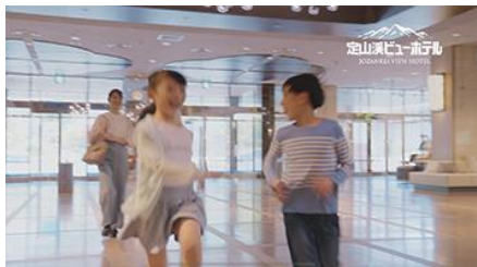
ロビーからスタート