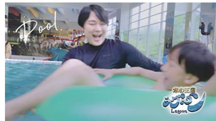
流れるプールで楽しむ親子