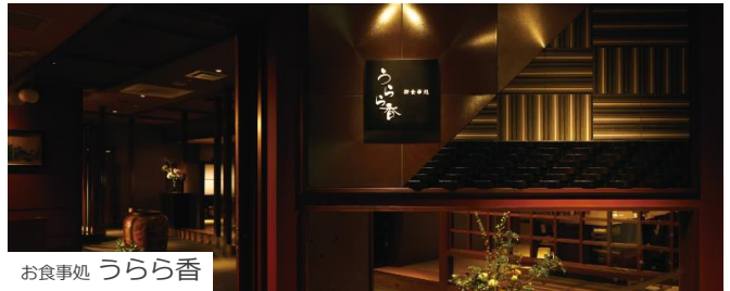
お食事処 うらら香

ブラックとゴールドを基調とした高級感溢れる空間デザインの「ロイヤルグランシャリオ」。全国から取り寄せた旬な厳選食材で作られる多彩な料理、色鮮やかでインスタジェニックな絶品スイーツなど、日常では味わうことのできないホテルクオリティの王道ビュッフェをお楽しみください。季節ごとに異なる旬の厳選食材を使用した和会席をお楽しみいただける、半個室の食事処「うらら香」もご用意しています。