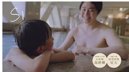
大浴場で親子仲良く入浴