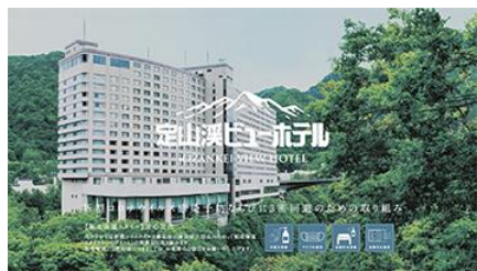
定山溪ビューホテル外観