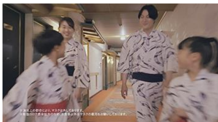
家族で館内を散策