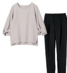
ライトグレー ×ブラック

■特長：可愛らしいつぼみ袖と美脚見えパンツが特長のセットアップ。シンプルな大人可愛いデザインで、どんなシーンにもピッタリな優れたもの。服選びを迷いがちな朝の時短にもつながる万能アイテムです。