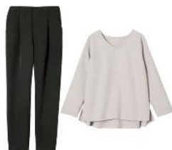
ライトグレー ×ブラック

■特長：裾が広がったペプラムデザインのトップスが印象的なセットアップ。伸縮性のある素材で動きやすく、様々なシーンで活躍すること間違いなし。ラクにフォーマルが完成する、働く女性の必須アイテムです。