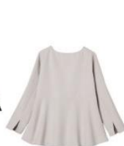
ペプラムデザイン