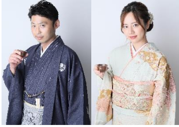
利酒師が選んだお酒を販売