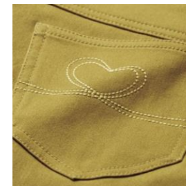
ステッチデザイン