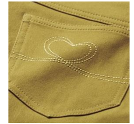
ステッチデザイン