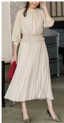
クラシカルワンピースセット2点スーツ