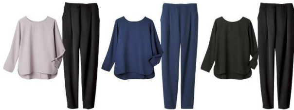
(左より) ライトグレー×ブラック・ネイビー・ブラック