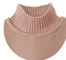
(左より) ブラック、ピンクベージュ、杳グレー