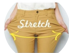
(左より) ブラック、ベージュ、ホワイト、モスグリーン、ラベンダー 抜群のストレッチ性