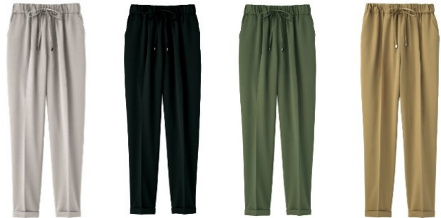
(左より) ライトグレー、ブラック、カーキ、ベージュ