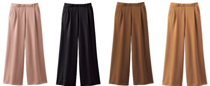
(左より) グレイッシュピンク、ブラック、ブラウン、キャメル