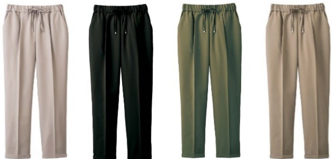
(左より) ライトグレー、ブラック、カーキ、モカ