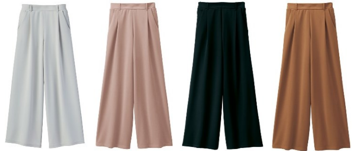
(左より) ライトグレー、グレイッシュピンク、ブラック、キャメル