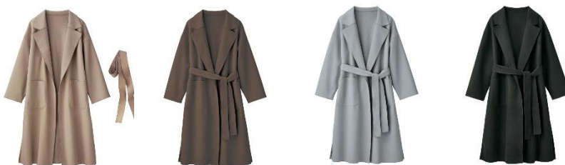
<ベージュ、ブラウン、ブルー、ブラック>

特長：サラッと羽織るだけで高見え&今っぽさ抜群！軽いのにあたたかく上品に魅せる、ふんわりとしたウールライク素材のロングチェスターコート。表裏両面起毛の1枚仕立てで柔らかく、カーデ代わりとしても便利なアイテムです。ドロップショルダーが女性らしく華奢に着こなせます。