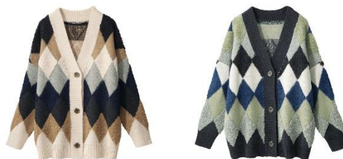
<アイボリー系、チャコール系>

特長：もこもことした編地とトレンドのアーガイル柄で価値観たっぶりのニットカーディガン。ゆったりめのシルエットで秋の軽めのアウターとしても活躍しそう。