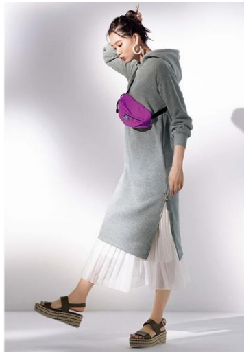
＜裏起毛裾ファスナーパーカーワンピース 1,990 円（税別）＞

今回は、各カテゴリーから新作アイテム計 3 点をピックアップ。トップスは「アーガイルニットカーディガン」、ワンピースは「裏起毛裾ファスナーパーカーワンピース」、アウターは「オーバーサイズチェスターコート」となります。中でも今季特にオススメのアイテムとして、累計販売枚数 4.8 万枚を突破した（2020 年 9 月時点）着こなし抜群の優秀ワンピース「裏起毛裾ファスナーパーカーワンピース」の特長やポイントをご紹介します。