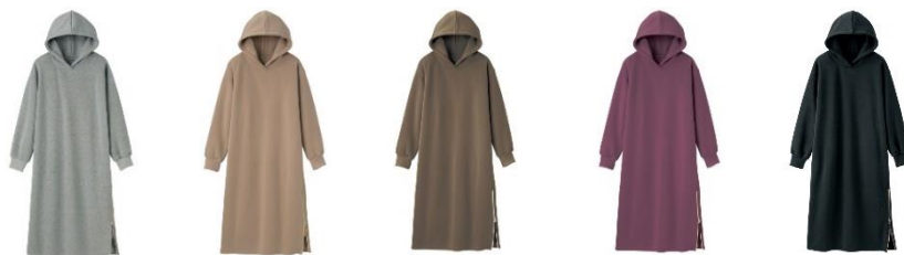
<杳グレー、モカベージュ、ブラウン、バイオレット、ブラック>

特長：着回し力抜群で毎日着たくなるアイテムです。トレンドのドロップショルダーのゆったりシルエットで簡単に今ドキコーデが完成！あったか裏起毛素材のため、ロングシーズン着用でき、今年の秋冬の強い味方になってくれること間違いなし。