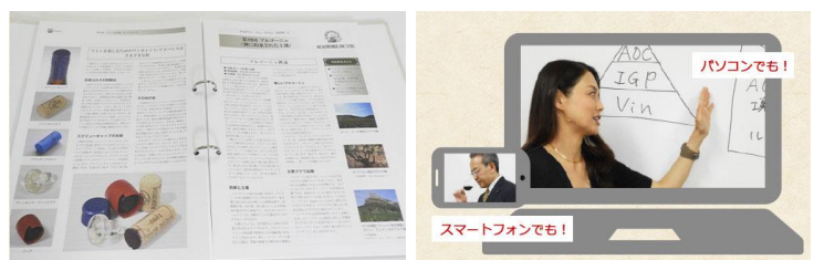
〈ワインスクール監修講座オリジナルテキスト・スクール講師による動画配信〉

マイワインクラブはワイン定期コース国内売上高 No.1 です。※東京商工リサーチ（2016 年度） ワインスクールとタイアップした有名講師の講座 緒に届く通信講座付き定期コースや、世界中のワインを楽しめる定期コースなど豊富な定期コースを取り揃えております。