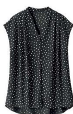
ブラック系ドット