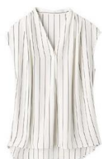
オフ白系ストライプ