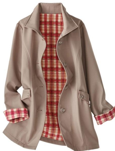
＜裏はあったかフリース仕様＞

“寒くなってきて羽織りたいけど着膨れしちゃう”そんな悩みを解決するのが「あったか裏フリース！優秀素材の大活躍コート」です。裏はフリース素材で暖かく、表はさらりとした肌ざわりでスッキリと着こなせます。洗練されたベーシックなデザインなのでどんなシーンにも合わせられます。