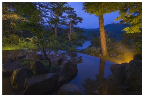
<源泉 100%かけ流しの絶景露天温泉>