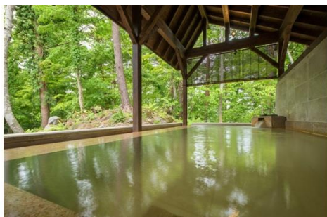
<迎賓館猫魔離宮専用「虹の森温泉」>