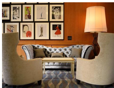
<アートを堪能出来るロビー>