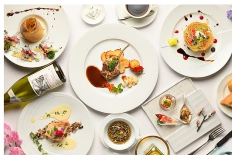
<夕食:カジュアルフレンチ>