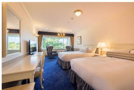
<スーペリアツイン(41㎡)>