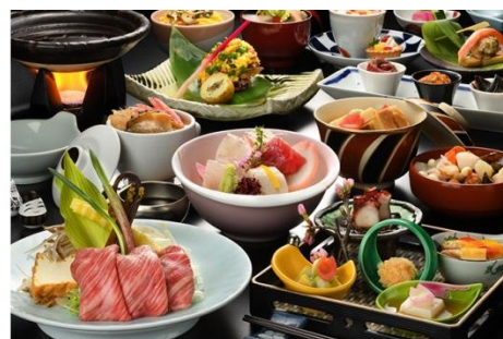
<夕食:季節の和会席>