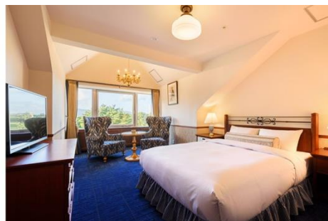
<ペンthouseデラックスダブル(34㎡)>