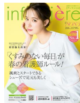
<アンファミエ 春号>