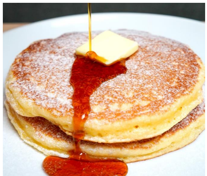
バターミルクパンケーキ ¥850

メレンゲを加えて低温でじっくり焼き上げたふわふわしゅわしゅわ食感が口の中でとろけるスフレパンケーキに自慢の生クリームをトッピングした『メープルクリームスフレパンケーキ』別添えのメープルシロップをたっぷりとかけてお召し上がりください♪ふわふわしゅわしゅわのスフレパンケーキにたっぷりのいちごとまろやかな生クリームが絶妙なバランスの『いちごのスフレパンケーキ』ヨーグルトと豆腐を加える事によりふわふわもちりに焼き上げたちょっとなつかしいパンケーキに北海道の良質な発酵バターをトッピングした『バターミルクパンケーキ』大人気のかき氷に加え一枚一枚丁寧に焼きあげた自慢の『パンケーキ』も是非ご賞味ください♪