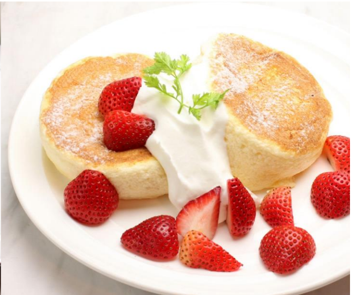
いちごのスフレパンケーキ ¥1,600

かき氷専門店『しろいくも』とコラボ中の『and 梅田』よりしっとりふわふわのパンケーキが新登場！