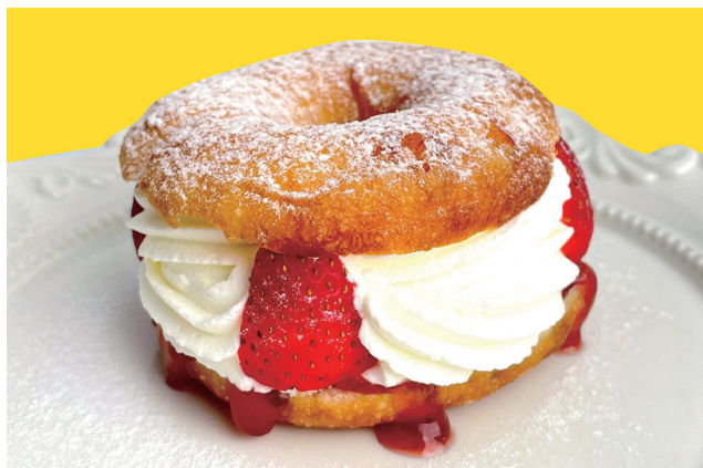
いちごとカスタード ¥650