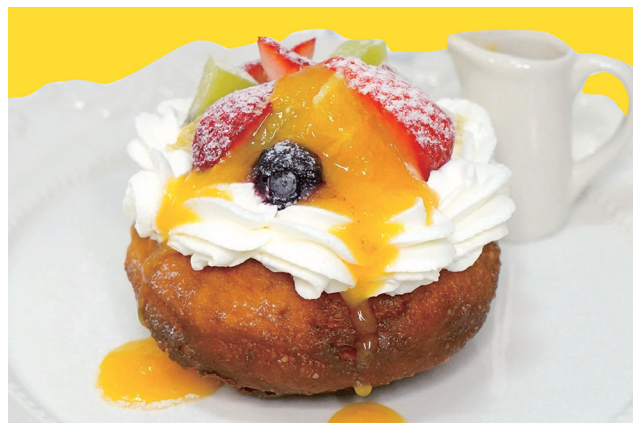
ミックスフルーツ ¥700