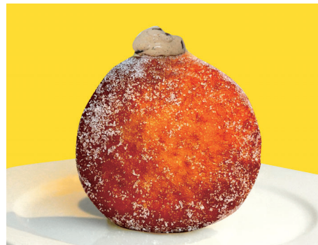
コーヒーゼリークリーム～コーヒー × コーヒーゼリー × 生クリーム～¥450

また イトイン限定 メニューとしていちごのミルフィーユをドーナツで再現した『 いちごとカスタード 』ドーナツにカスタードと生クリーム、いちご、キウイ、オレンジをトッピングし自家製のミックスジュースソースをかけてお召し上がりいただく『 ミックスフルーツ 』などなど…是非ご賞味ください！