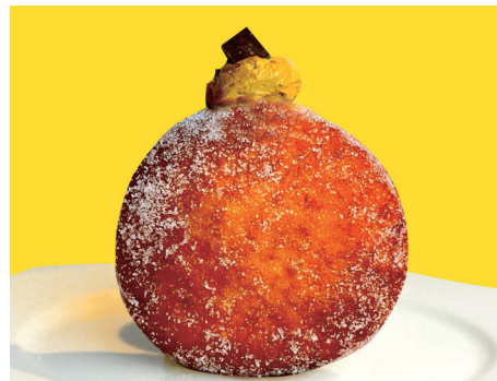
チョコレート ～チョコレート × 生クリーム～¥450