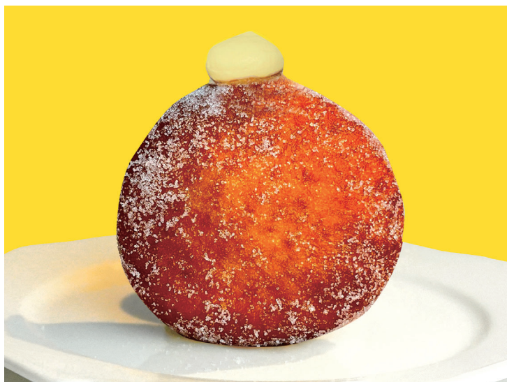
ミックスジュース

株式会社 LIFEstyle (本社：大阪市北区) は『千成屋珈琲ラゾーナ川崎プラザ』にて、とろける口当たりの新食感 生ドーナツ『レトロボンボローニ』 を販売開始いたします！