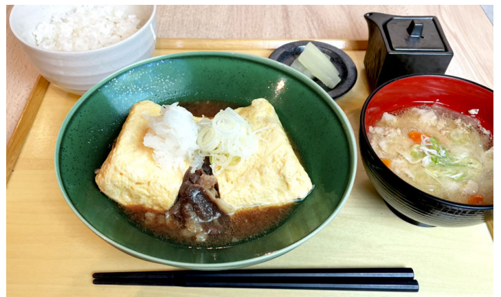
肉巻きたまご焼き定食 ¥900